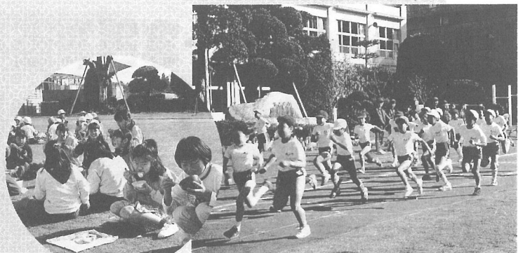
みんなで食べるとおいしいね(大総小学校)

レースの後は、PTAのみなさんが用意したつきたての「もち」で腹ごしらえ。友達と一緒に食べる「おしるこ」はよほどおいしかったようで、「もう一杯。もう一杯」とおかわりする子どもたちに、先生もおかあさんたちもみんなびっくりしていました。