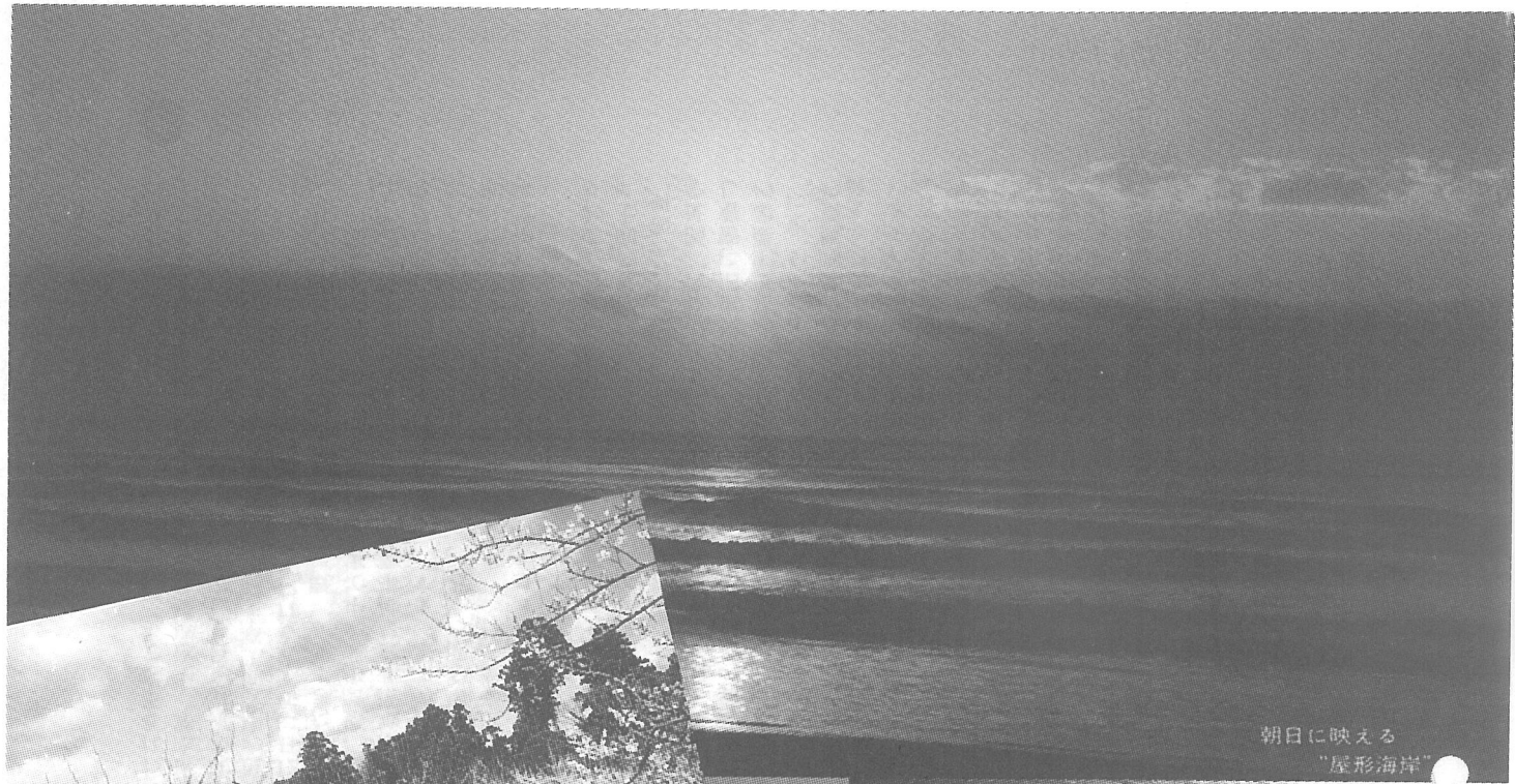
朝日に映える "屋形海岸"