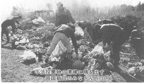
不法投棄物の清掃に情を出す 両国新田のみなさん（3月）

廃棄物の不法投棄をなくし、清潔で明るい町づくりを推進するため、住民のみなさん一人ひとりのご協力をお願いいたします。