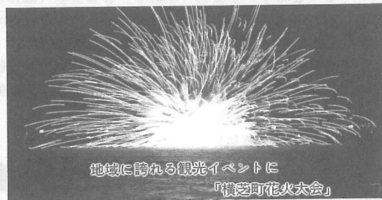
地域に誇れる観光イベントに 『横芝町花火大会』

20,249,000円(収入)-15,579,000円(支出)=4,670,000円(翌年度繰越金)