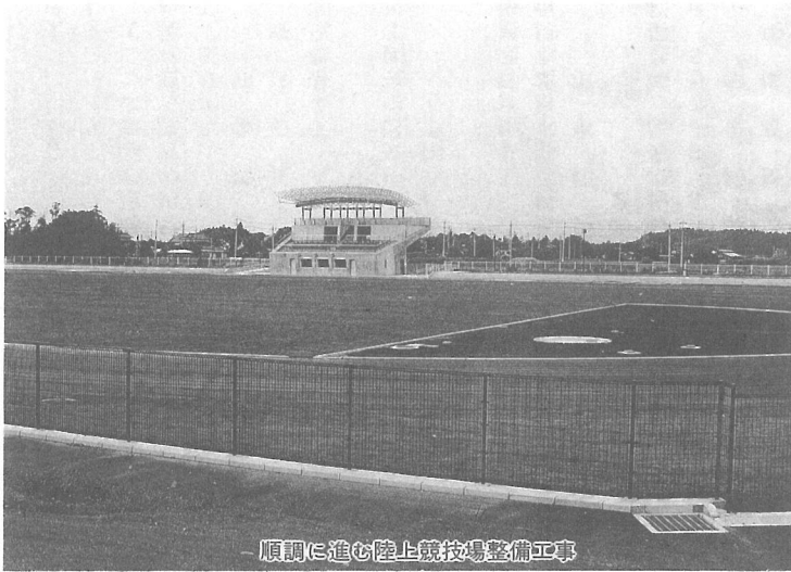
順調に進む陸上競技場整備工事

一般会計における収入面では、私たちが納めた税金をはじめ、国や県からの補助金・交付金などで総額56億3,023万7千円となり、一方支払われたお金は53億9,237万9千円で、差引き2億3,785万8千円の繰越となりました。 今月号ではその概要についてお知らせいたします。