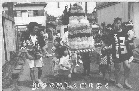
親子で楽しく練り歩く