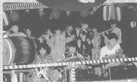
▲老人ホーム盆踊り大会 (8月6日)