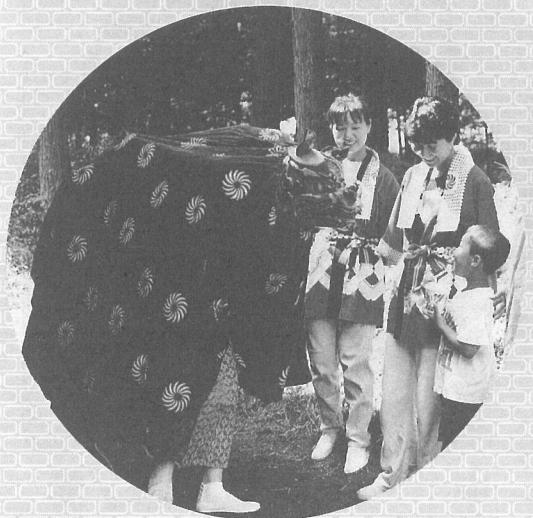
五穀豊穡と氏子の安全を祈願した平獅子の舞