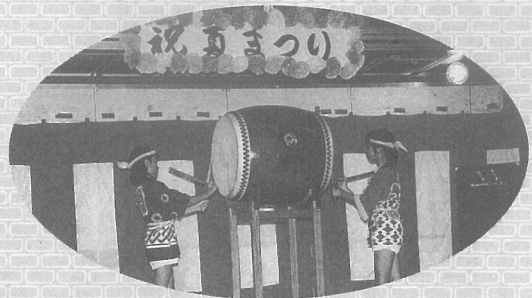
子どもたちは祭りの主役