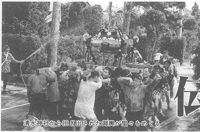
清水神社から担ぎ出された御輿が里々をめぐる