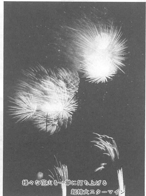
様々な花火を一挙に打ち上げる 超特大スターマイン