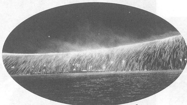
クライマックスはナイアガラ