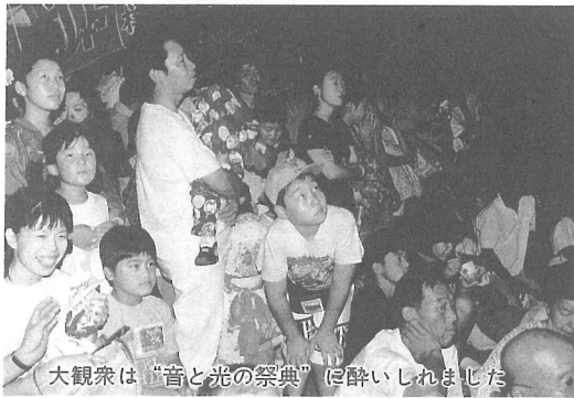
大観衆は“音と光の祭典”に酔いしれました

「ドーン」腹の底まで響く大音響とともに、坂田池の湖面に花 咲く超特大水中スターマイン。地上400メートルで色とりどりの 大輪の光を放ち、夜空を焦がした尺玉花火。8月9日の土曜日、 当町の一大イベント「第8回横芝町花火大会」が、町内外から7 万人の大観衆を集めて盛大に行われました。 この日は朝から風が大変強く、一時は開催が危ぶまれていまし たが、「横芝の花火」を楽しみにしている人たちからの問い合わせ が殺到。関係者一同で十分な協議を行った結果、警備態勢を厳重 に行うことを前提に実施することが決定しました。お盆間近とあ って帰省した人たちも、家族団らんの中で、ふるさとの夜空を彩 る花火にすっかり酔いしれているようでした。 関係者のみなさん大変お疲れさまでした。