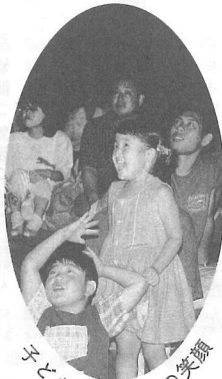
子どもたちもこの笑顔