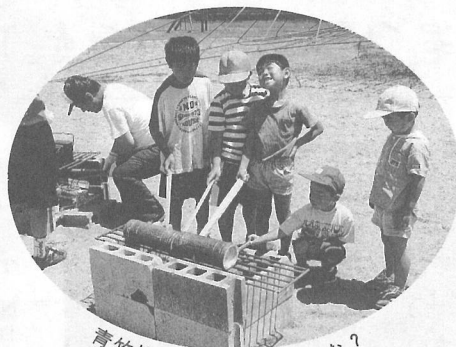
青竹炊飯うまく炊けたかな?