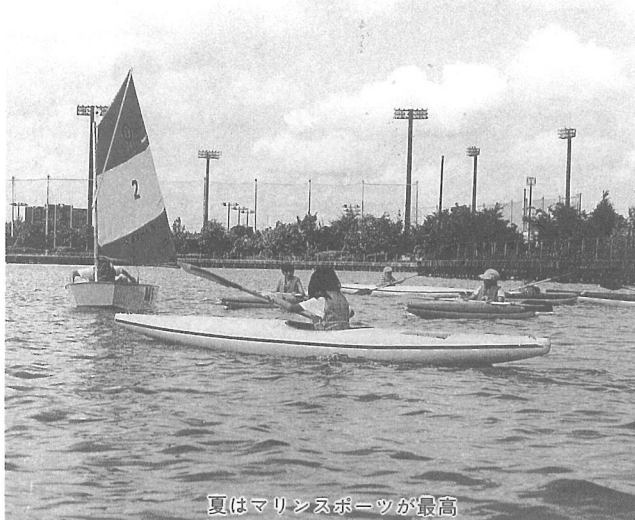
夏はマリンスポーツが最高

そして、青竹を使っての箸づくりや飯ごう炊きさん、宝さがしなど教室での勉強とはひと味ちがった楽しい一日を過ごしました。