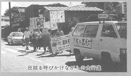
反核を呼びかけながらの大行進

この行進は、核戦争防止・核兵器絶滅など「核兵器のない世界」を目指し「歩く」という誰にでもできる行動で、平和の大切さを呼びかけているもので、午後2時45分、役場に到着したみなさんは、町長からのメッセージを受けた後、上町から本町を通り、横芝駅までの道程を行進しました。