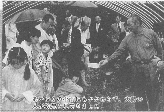
あいにくの小雨にもかかわらず、夫婦の 人が放流を見守りました