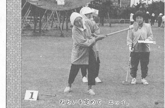
1 ねらいを定めて エッイ。

5月22日、ふれあい坂田池公園で第1回町老人クラブ連合会グランドゴルフ大会が開かれました。 曇り空の下、みなさんステイックに力を込めて熱心にプレー。ホールインワンの好プレーも続出しました。