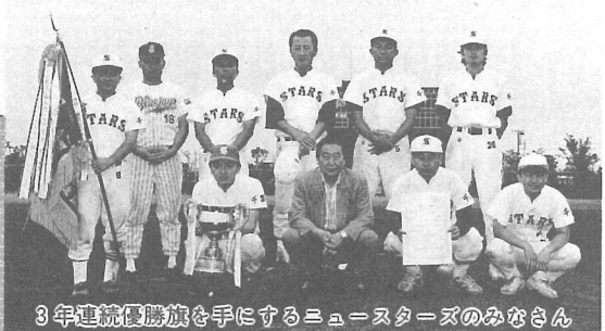
3年連続優勝旗を手にするニュースターズのみなさん