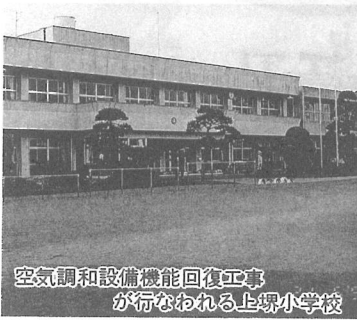
空調和設備機能回復工事が行われる上堺小学校