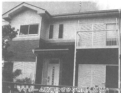
住宅取得にぜひご利用ください