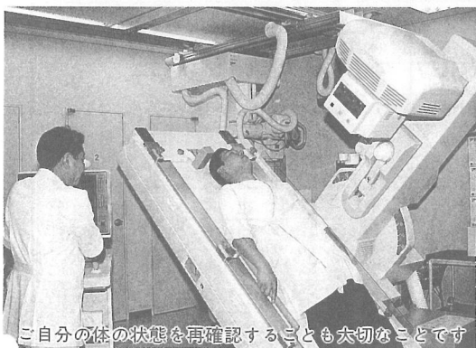
ご自分の体の状態を再確認することも大切なことです