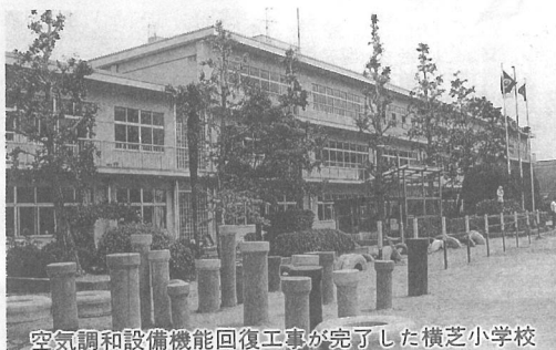
空気調和設備機能回復工事が完了した横芝小学校