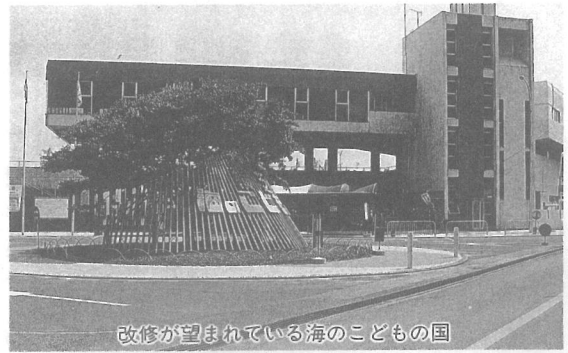
改修が望まれている海のこどもの国

帯の一体化した整備計画は考えていないのか。③当町の海岸付近は車の駐車スペースが少ない。駐車場整備の考えはないのか。④南川岸地区は、洪水などの時蓮沼の下水が流れてきて大変困っている。改善策はないか。