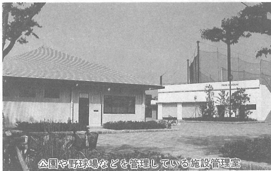
公園や野球場などを管理している施設管理室

問 ①当町は、公園などの管理部門も町職員が直接行っているが、昨今の厳しい経済状況の中で、定年を待たずに退職された有能な人たちをその管理運用面で活用することはできないのか。②今議会でも保育所の定数は正