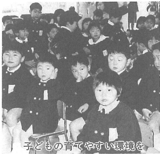
子どもの育てやすい環境を

答 多くの女性が社会へ進出することは大いに喜ばしいことだが、反面、このような問題がおきていることも事実であり、当町においても、子どもの人口は年々減少しているのが実態である。千葉県ではすでに「千葉県子どもプラン」という施策を策定し、今年度から10年をめぐりに、