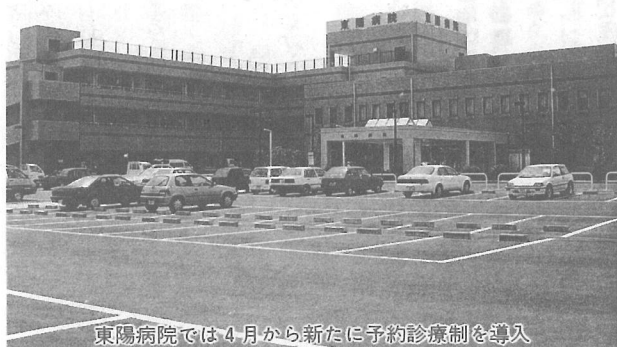
東陽病院では4月から新たに予約診療制を導入

予約診療制になりますと、継続して治療を受けられる方は2度目の診察から日時（1時間単位）が指定されるため、待ち時間が少なくなり朝早くから診察を待つ必要がなくなります。