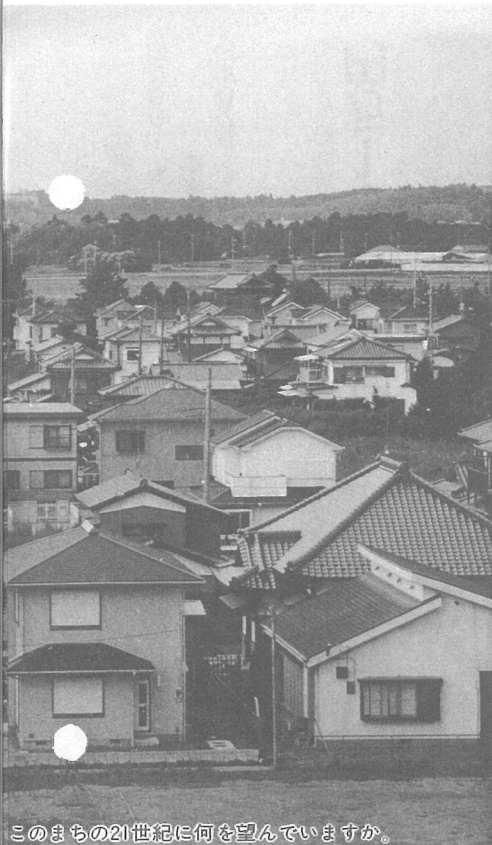
このまちの21世紀に何を望んでいますか。

利用」「海や川 のきれいさ」「道 路の広さや舗装」 「交通安全」「下 水・排水処理」 「航空機落下物・ 騒音」などは4 割以上の人が不 満を感じており、 非常に低い評価 です。(グラフ3)