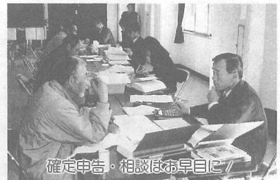
確定申告・相談はお早目に

※問い合わせは、東金税務署(☎0475-52-3121)または、役場税務課(☎内線225)へ。