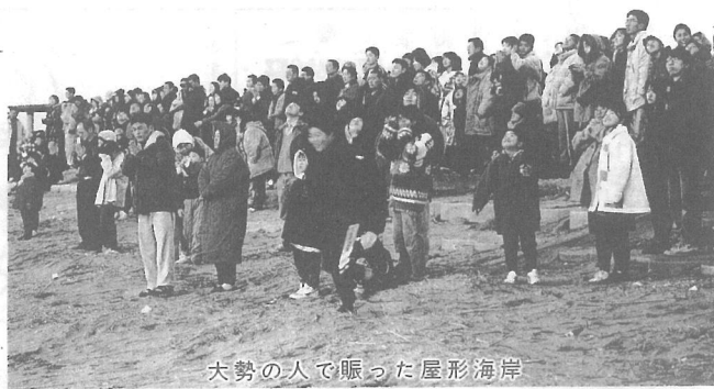
大勢の人で賑った屋形海岸