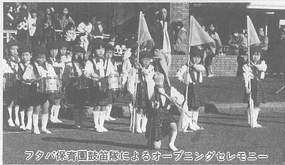
フタバ保育園鼓笛隊によるオープニングセレモニー