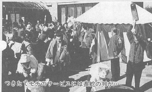
つきたてモチのサービスには長蛇の列が…