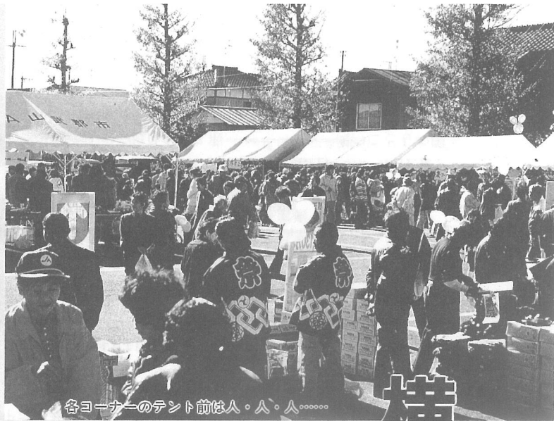
各コーナーのテント前は人・人・人……