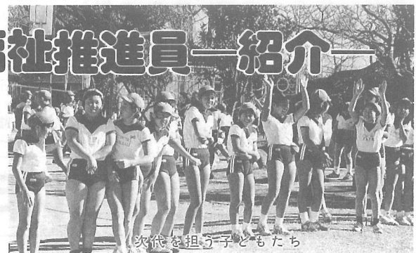
次代を担う子どもたち

平成7年12月1日付けで、次の方々が民生児童委員と母子福祉推進員として新たに委嘱されました。 民生児童委員、母子福祉推進員は民間の奉仕者で、生活に困ったときや子どもとの問題、母子家庭に関する事など、良き相談相手となり、苦しんでいる人たちの指導援助などを行います。 また2名の主任児童委員は主に町内の子どもに関する悩みや相談を受けます。 困ったときは、お気軽にご相談ください。