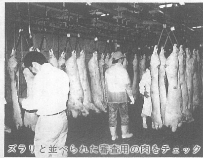
ズラリと並べられた審査用の肉をチエツク