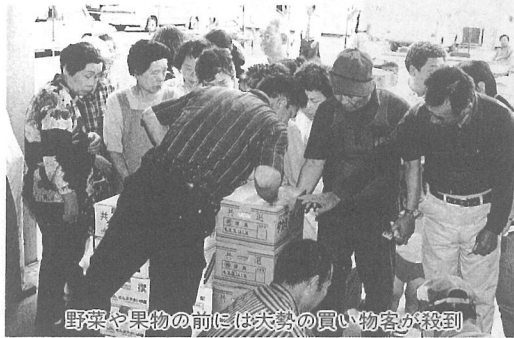
野菜や果物の前には大勢の買い物客が殺到

第20回夏期農業改良共進会が6月21日、役場駐車場で行われました。今年には昨年に比べ、日