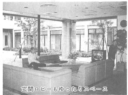
玄関ロビーもゆったりスペース