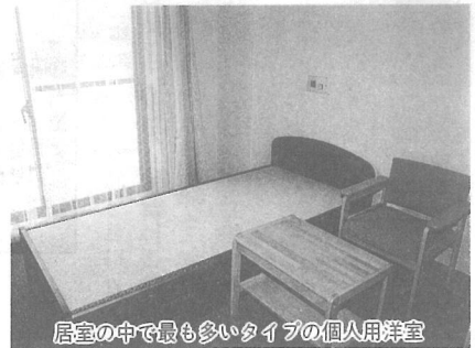
居室の中で最も多いタイプの個人用洋室