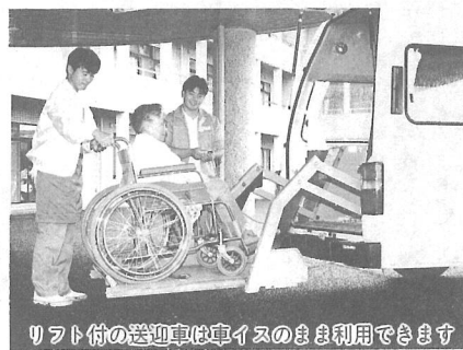
リフト付の送迎車は車イスのまま利用できます