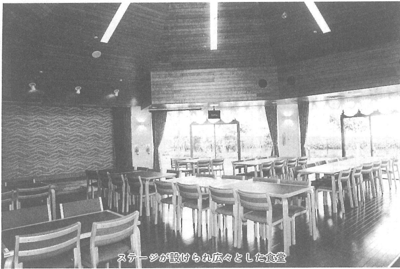
ステージが設けられ広々とした食堂