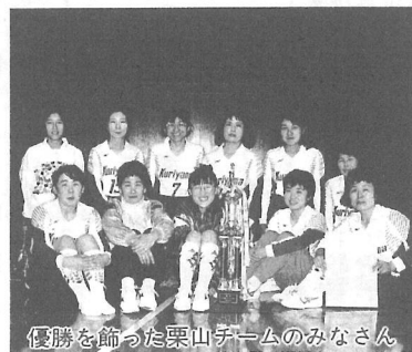
優勝を飾った栗山チームのみなさん