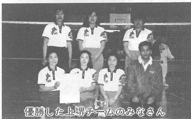
優勝した上堺チームのみなさん

今回で24回目を迎えた婦人バドミントン大会が2月19日、海洋センターを会場に参加6チームで行われ、上堺チームが栗山Bチームを降し、優勝に輝きました。 主な結果は次のとおりです。