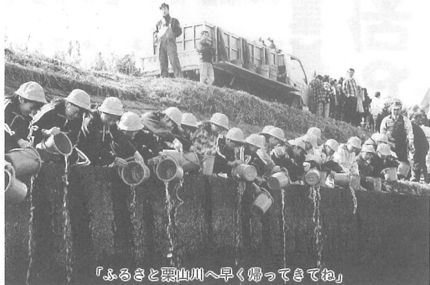
「ふるさと栗山川へ早く帰ってきてね」

恒例となったサケの稚魚の放流が3月8日、栗山川横芝堰で行われ、今年は、100万尾が横芝小、上堺小、日吉小(光町)の児童ら199名の手で放されました。 体長約6cmの稚魚は、北海道で生まれたものと栗山川へ帰ってきたものを県内水面水産試験場で育てたもの。 「早く帰ってきてね。」「また逢おうね。」と子どもたちは、再会の願いを込めているようでした。 今年は、218尾のサケが帰ってきたということですが、今年放流したサケも3、4年後大きくなってふるさと栗山川へ姿を見せてくれるといいですね。