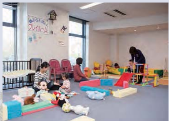
プレイルームは親子で利用でき、安全な遊具や玩具も豊富