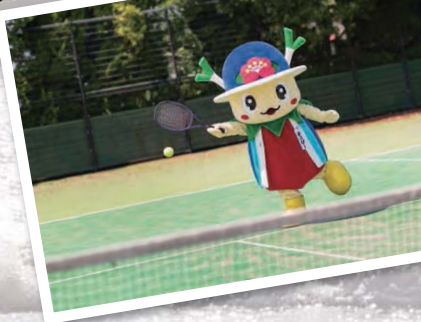
06 光しおさい公園・光B&G海洋センターでは、テニスやサッカー、水泳などさまざまなスポーツが楽しめる