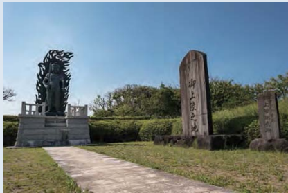
04 成田山御本尊 不動明王上陸之地