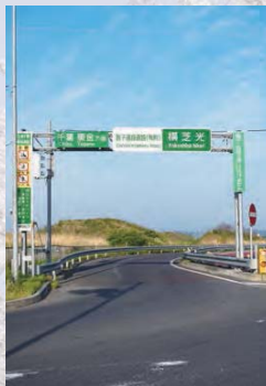
03 銚子連絡道路の横芝光インターチェンジ