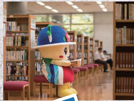
館内には心地よいBGMが流れる