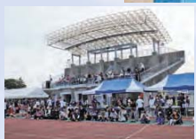
830人を収容する陸上競技場