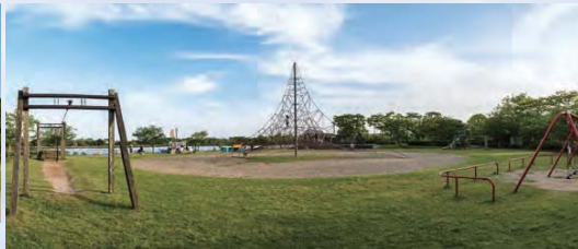
四季折々の花と豊かな自然が楽しめる公園内