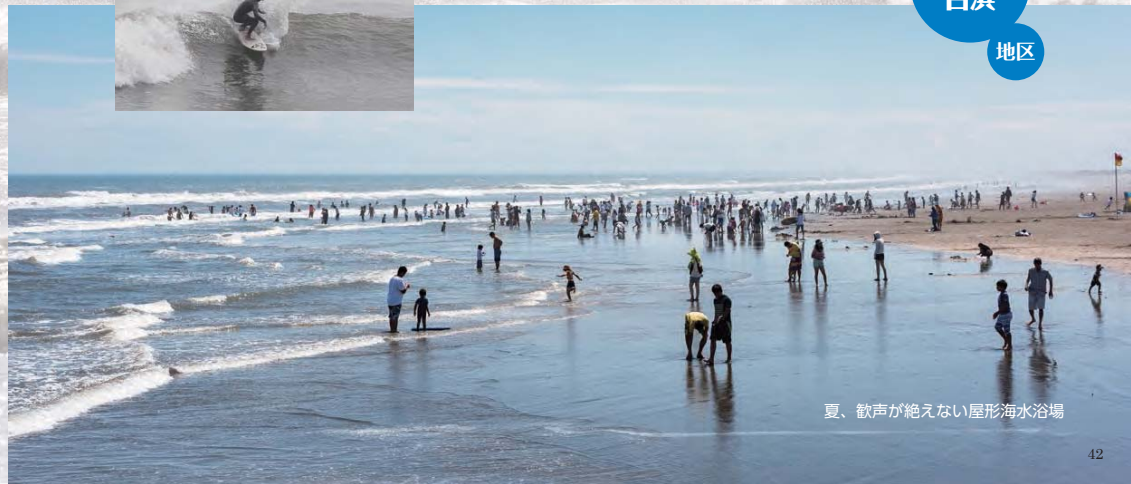
夏、歓声が絶えない屋形海水浴場