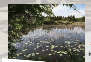
11 乾草沼とハスの花