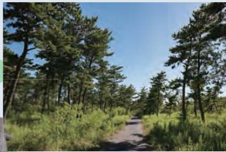
03 海を感じながら森林浴ができる 横芝海滨の森