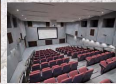
2階にはハイビジョンホールやギャラリーも