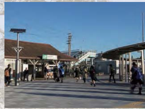
06 JR総武本線の横芝駅