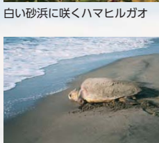
アカウミガメの産卵の場所でもある木戸浜海岸