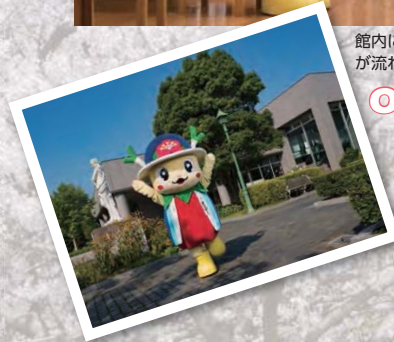
01 横芝光町立図書館

「JR総武本線と国道126号が平行して走るこの地区には、銚子連絡道路の横芝光インターもあり、交通の要衝です。役場庁舎をはじめ町民会館、町体育館、文化会館、さらには町立東陽病院、健康づくりセンター「プラム」など多くの公共施設が集積しています。町立図書館やフランス庭園などで知られる光文化の森公園は、緑が輝く栗山平和公園は憩いのスポットとして親しまれています。乾草沼には希少なトンボが生息するなど、自然のままの姿が残っています。