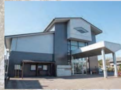
05 健康づくりセンター「プラム」