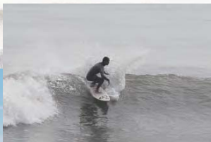
02 近隣はもちろん遠方から訪れるサーファーも