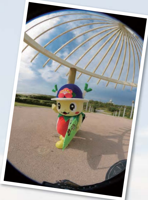
01 「マリネピアくりやまがわ」でのよこびー

Southern Area A tour to discover the charms of our town with Yokopy starts from a location in the southern part of the town looking out over the Pacific Ocean. This is an area where people can enjoy the scenery and various marine leisure pursuits available at Kujukuri Beach which has gained popularity as a bathing as well as a surfing spot. Nature abounds, with little terns flying in flocks, Kidohama Beach hosts beach morning glory flowers and sea turtles laying their eggs. Hikari Shiosai Park, equipped with soccer fields and tennis courts, and Hikari B&G, with its indoor pool, have become popular as local centers of sports activities.