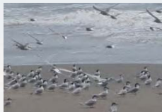
町の鳥・コアシサシが群れ飛ぶ