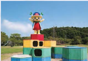
ふれあい坂田池公園で遊ぶよこびー