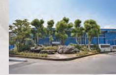
02 1世紀を超える歴史を有する 食肉センター

Central Area This area, in which the JR Sobu Mainline railway and National Route 126 run alongside each other, also contains the Hikari Interchange of the Choshi Renraku Road and is a major transportation artery. A number of public facilities, such as the Town Administration Building, the Public Hall, the Town Gymnasium, the Cultural Hall, the Toyo Municipal Hospital, and PLUM Health Center, are concentrated here. The Town Library and the Hikari Cultural Forest Public Park, renowned for its French garden, are used by many people as centers of cultural activity. Kuriyama Peace Park with its lush greenery is popular with the townspeople as a spot to relax and wind down. Nature is conserved in its pristine state at Higusu Pond inhabited by rare species of dragonflies.