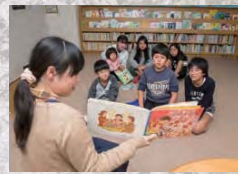
毎週土曜日に開催されている「おはなし会」