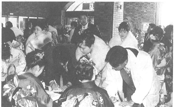
受け付け場所では「久しぶり、元気だった？」という声がたくさん聞かれました

です。そしてもう一つの抱負は、多くの人との出会いを大切に、良い所を真似て人間を磨くことです。色々な人に色々な話をきけば、自分の興味も広がり、やりたい事が見つかるかもしれません。相手を思いやり、気を配り、周囲の状況を判断して行動していけば、きっと素晴らしい女性になれるでしょう。そして素晴らしいパートナーと幸せになれるはず。同級生で結婚している人も、赤ちゃんのできた人もいる中で、まだまだ子供みたいな私ですが、この二つをしっかりと実行していきたいと思