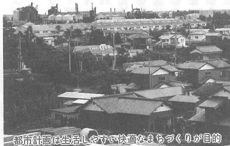
都市計画は生活しやすい快適なまちづくりが目的

町の中心地にふさわしい形として将来的には整理していきたい。そのためには、現在駅裏で操業している2社のコンクリート会社の協力が必要となるが、既に1社については移転が決まり、もう1社についても基本的には同意いただいている。また、駅前東側の国鉄清算事業団用地についても取得する方向で検討している。