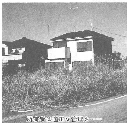
所有者は適正な管理を……

無線と町広報紙で適正な管理を促し、防災上危険性の高い箇所については、消防署との連名で土地所有者に対し刈り取り等の協力を要請する。