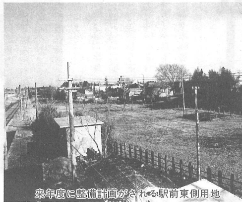
前年度に整備計画が完了した駅前東側用地

来年度の主な事業としては、スポーツ広場の2期工事や駅前東側用地の整備計画の策定、農業集落排水事業の事業計画の策定、保健福祉センターの基本計画設計、県道横芝下総線バイパス事業の推進等を予定している。