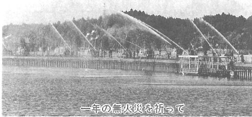
一年の無火災を祈って

また、式典終了後はふれあい坂田池公園で、全部隊の消防自動車27台による一斉放水を行いました。一年の無火災を祈願しました。