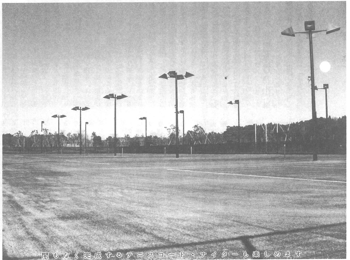
間もなく完成するテニスコート。ナイターも楽しめます

ため、現在、関係市町村が共同して都市機能の集積や住宅地の供給、居住環境の整備等の基本方針に基づいた計画策定作業を進めている。 基本計画は概ね10年間を目標としており、当町としては、町の基本計画等に位置付けられた海の子どもの国周辺の整備拡充や栗山川の改修、芝山鉄道の延伸、公共下水道の整備等を盛り込んでいくよう検討している。