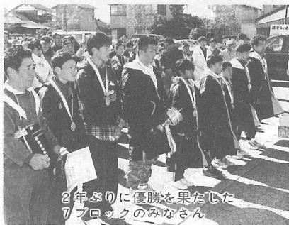
2年ぶりに優勝を果たした7ブロックのみなさん

また、今年は第20回の記念大会ということで、閉会式では1位から6位までの各ブロックへ、トロフィーが贈られました。