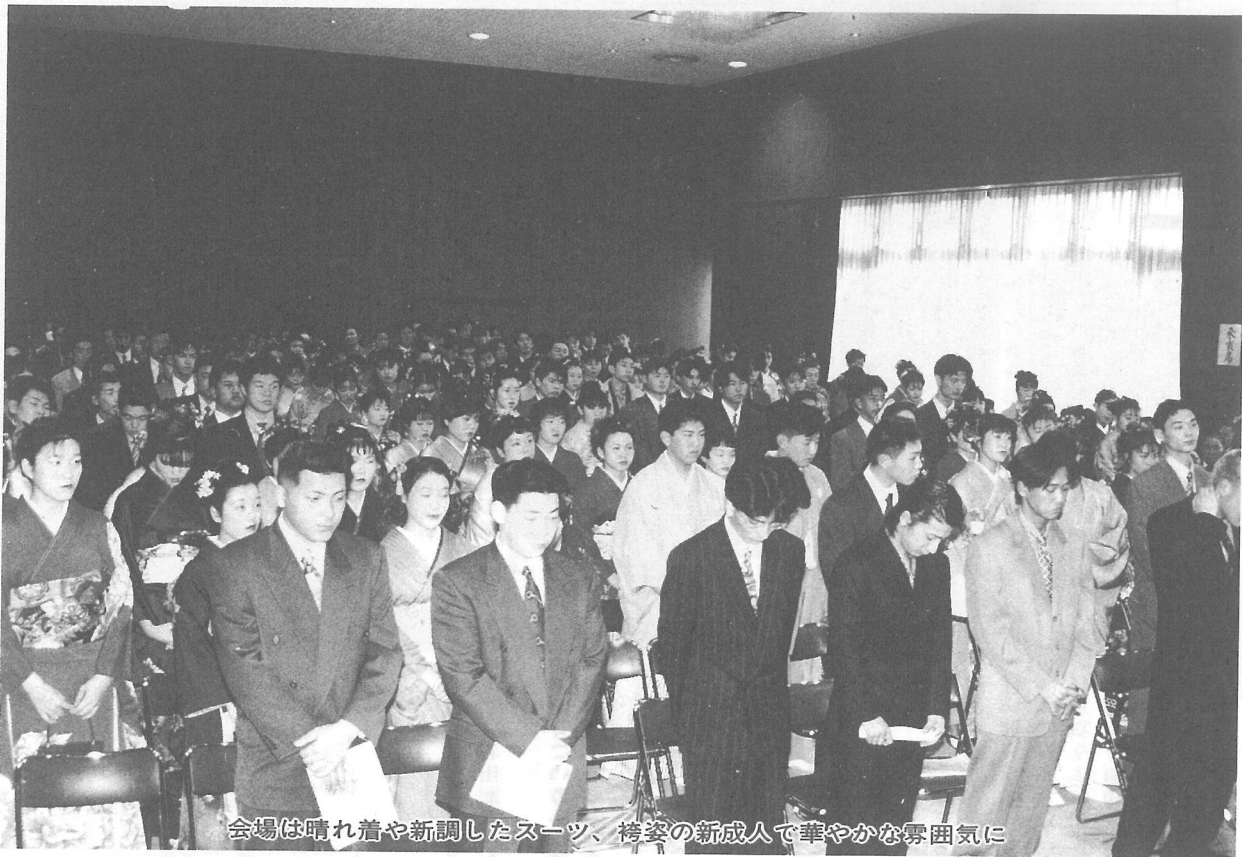
会場は晴れ着や新調したスーツ、袴姿の新成人で華やかな雰囲気