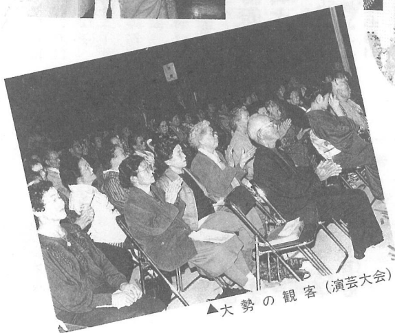
▲大勢の観客(演芸大会)