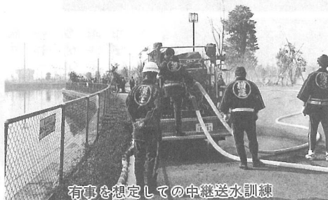
有事を想定しての中継送水訓練

これは町が、古くなった消防ポンプを新しくすることにより、火災の被害を少しでも防ごうと計画的に整備しているものです。