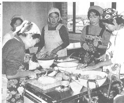
▶お母さんが見守る中 料理に取り組む子どもたち (母と子の料理教室)