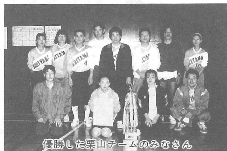
優勝した栗山チームのみなさん

「未来に伸ばそう！ 山武の農林業」をテーマに、第9回山武地域農林業まつりが11月3日、蓮沼村で開催されました。会場となったスポーツプラザの駐車場には、テントがズラリと設けられ、東金市と郡内8町村が、それぞれ地域の特産物の即売などを行いました。横芝町は、みつば、ミニトマト及びシャコバサボテンの即売のほか、カリカリ梅と梅酒の試食試飲コーナーも設置。訪れた人の人気を集めていました。