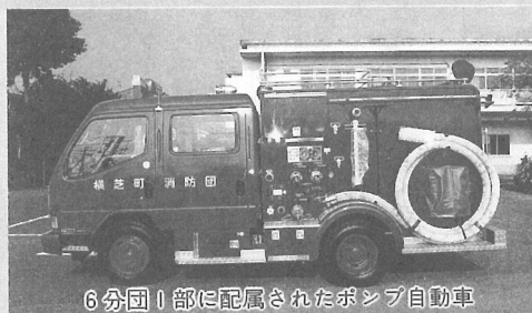
6分団1部に配属されたポンプ自動車

この程、横芝町消防団6分団1部(長倉)にポンプ自動車、5分団1部(木戸台)と2分団1部(新島)に小型動力ポンプ付積載車、5分団3部(寺方・曾根合)と6分団2部(姥山)に小型動力ポンプ積載車がそれぞれ配属されました。