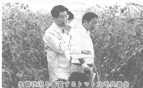
生育状況を審査するトマト立毛共進会

10月17日、トマト立毛共進会が町内トマト生産農家のほ場で行われました。 当日は、山武農業改良普及センター松尾支所職員や、JA山武の指導員などが20戸の農家を回り、実の付き具合や“木”の生育状況などを審査しました。 入賞者は次のとおりです。