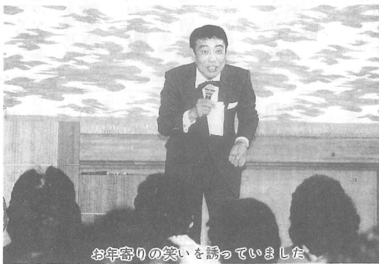
お年寄りの笑いを誘っていました

10月27日、上堺小学校で「上堺小域福祉のつどい」が開かれ、上堺地区のお年寄りのみなさん