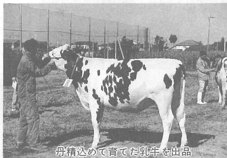
丹精込めて育てた乳牛を出品

18頭の乳牛が競い合う 第17回畜産共進会 家畜の改良技術の向上と畜産の発展を目的とした畜産共進会が11月4日、町運動広場を会場に開催され、町内の酪農家から出品された18頭の乳牛が、体形や将来性などを競いました。入賞者は次のとおりです。