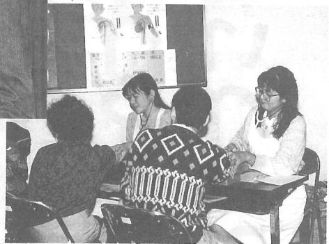
「血圧はまあまあですね」 (健康相談)