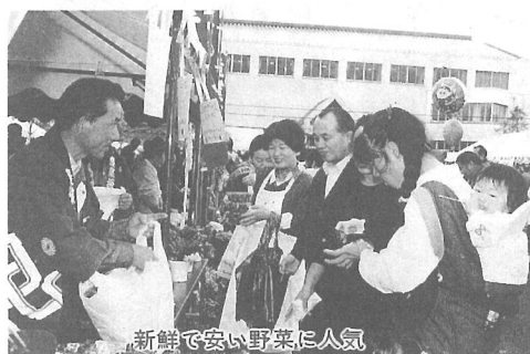
新鮮で安い野菜に人気

「未来に伸ばそう！ 山武の農林業」をテーマに、第9回山武地域農林業まつりが11月3日、蓮沼村で開催されました。会場となったスポーツプラザの駐車場には、テントがズラリと設けられ、東金市と郡内8町村が、それぞれ地域の特産物の即売などを行いました。横芝町は、みつば、ミニトマト及びシャコバサボテンの即売のほか、カリカリ梅と梅酒の試食試飲コーナーも設置。訪れた人の人気を集めていました。