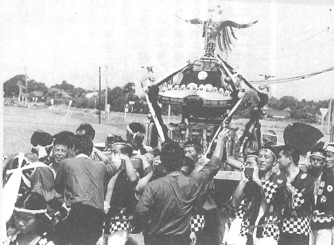
北清水夏祭り・8月7日

記録的な猛暑となった今年の夏——。八坂神社の祇園祭をはじめ、木戸台地区の風祭りや栗山地区の盆踊り、古川地区のふるさと祭りなど、今年もそれぞれの地域で「祭」が賑やかに行われました。笛や太鼓のお囃子、汗が飛び散る御輿渡御、浴衣姿も艶やかに広げた踊りの輪、そんな今年の「夏祭り」を追ってみました。