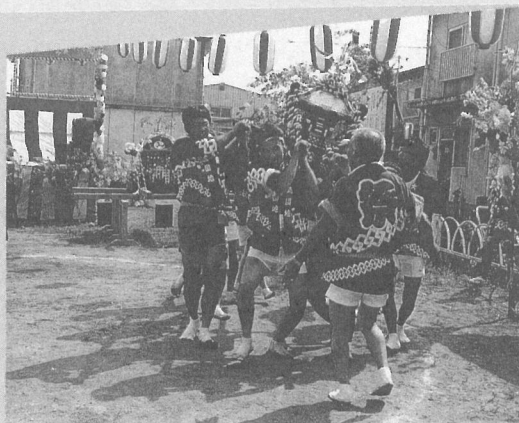
▲大島団地子ども祭り・8月7日