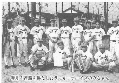
春夏4連覇を果たしたラッキーボーイズのみなさん