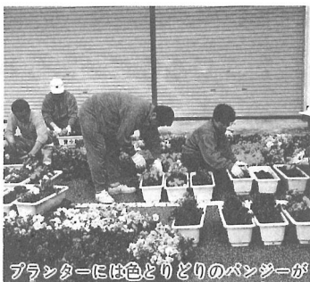
プランターには色とりどりのパンジーが