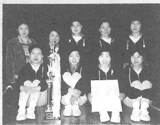
▶優勝した横芝クラブのみなさん

主な結果は次のとおりです。 優勝 横芝クラブ 準優勝 栗山チーム 第3位 中台ママさん