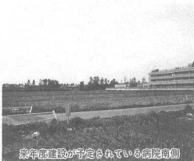
来年度建設が予定されている病院南側