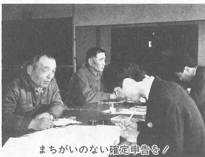
まちがいのない確定申告を!

平成5年分の所得税の確定申告は、2月16日から始まります。申告期限は、3月15日です。期限間近になりますと、税務署、役場税務課窓口は大変混雑し、落ち着いて相談できなかつたり、長時間お待ちいただくことにもなりますので、申告は、なるべく早めに済ませてください。