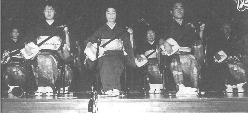
▲力強い音が響きわたった三味線合奏