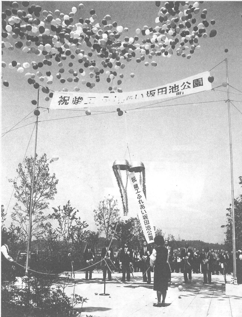
▲8年の歳月をかけ整備を進めていたふれあい坂田池公園が完成。待望の全面オープンとなりました。