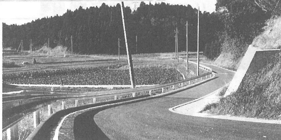
▲ゴルフ場開発に伴う周辺対策事業の一環として整備を進めていた姥山、町原間の通学路1.6キロが完成。