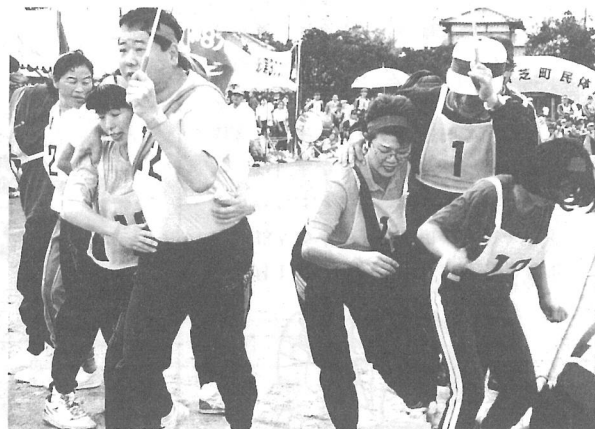
▼なかなかお似合いですよ