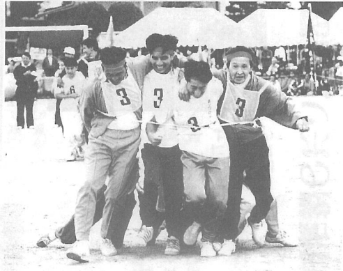
▲あれあれ後の人が……