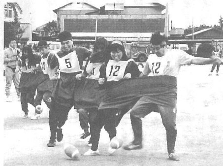
◀ラグビーボールに大苦戦