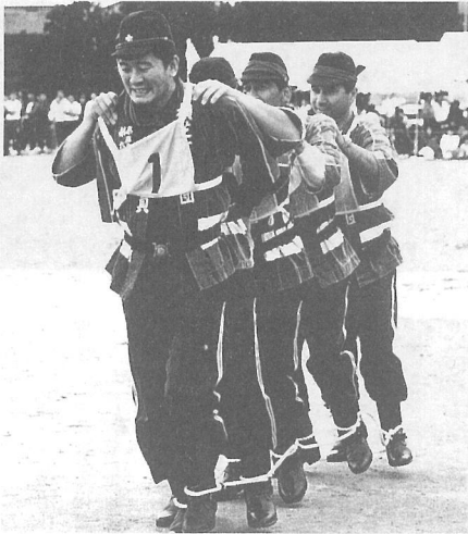
◀あと少し：イッチニ・イッチニ