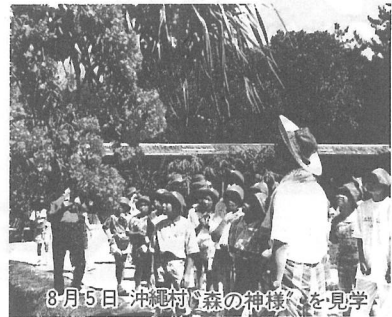
8月5日「沖縄村」森の神様を見学

空港から3時間ぐらい飛行機に乗り、沖縄の那覇空港に到着。外へ出てみたらとても暑く、とてもきれいな景色にびっくりした。真つ赤なハイビスカスの花