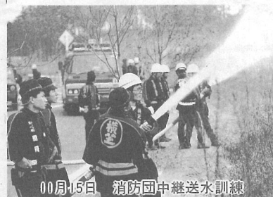
00月15日 消防団中継送水訓練