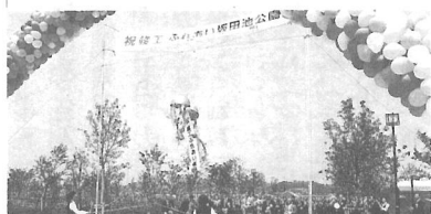
公園整備事業 5月25日 ふれあい坂田地公園竣工式