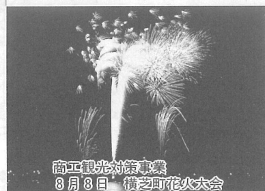
商工観光対策事業 8月8日 横芝町花火大会