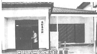
コミュニティ助成事業 2月20日 本町集会所落成式