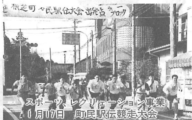
スポーツ・レクリエーション事業 10月17日 市民駅伝競走大会