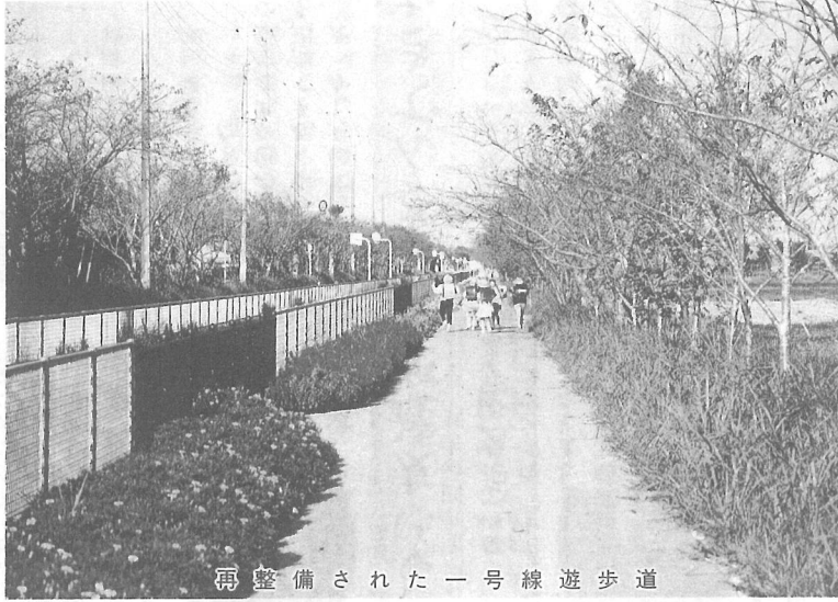
再整備された一号線遊歩道