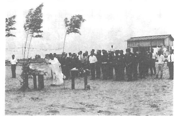
7月14日には安全祈願祭が行われました

これは海水浴に訪れるみなさんに、安全でより快適に楽しんでもらおうと、毎年婦人会やボランティアの方々の協力を得て行っているのですが、依然として不法投棄やポイ捨てが多く、この日集められたゴミは空カンや空ビンだけでもトラック3台分にもなりました。また、松林の周辺には、家具や電化製品などの生活用品のほか、車までが捨ててある始末。