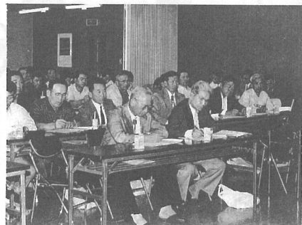
▶熱心にメモをとる農家のみなさん

この会は、町の基幹産業である農業が、米の生産調整や農産物の輸入自由化などによって依然厳しい状況下にあることから、横芝町農業振興会が主催し行つたもので、活力ある農村づくりを目指し活発な意見交換がされました。 また、稲作、園芸、畜産農家の経営者から事例発表も行われ、参加者は熱心に耳を傾けていました。