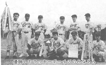
優勝したラッキーボーイズのみなさん

決勝戦は昨年と同カードで、連勝を狙う栗山チームと、それを阻止しようとする横芝クラブ