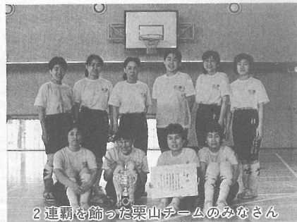
2連覇を飾った栗山チームのみなさん

町内のママさんバレー7チームが参加した「あじさい大会」が6月6日、上界小学校体育館で行われました。