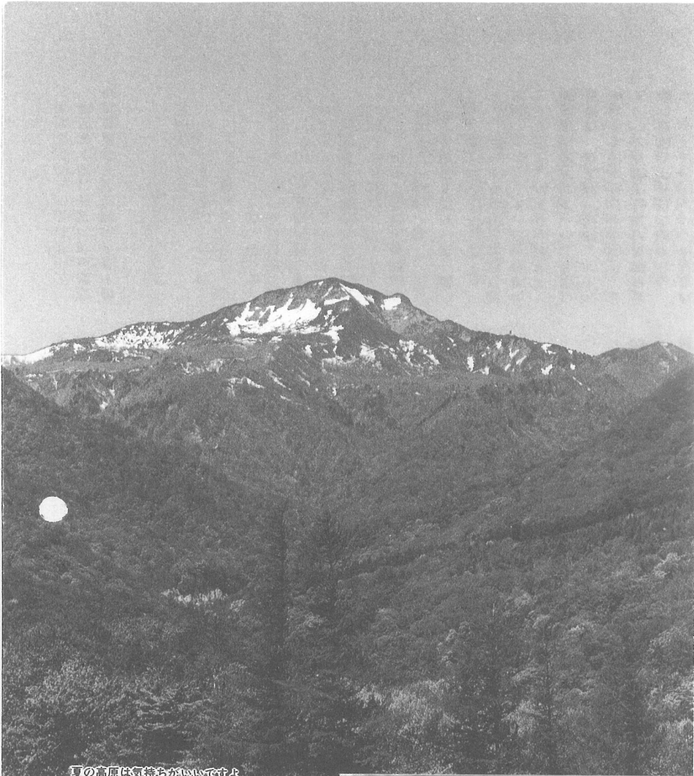
夏の高原は気持ちがいいですよ キャンプ場からのぞむ三本槍岳 (1917m)