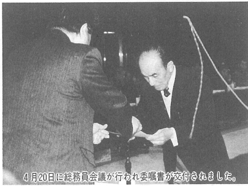
4月20日に総務員会議が行われ委嘱書が交付されました。