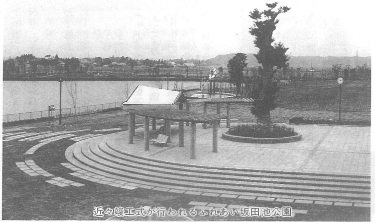
近々竣工式が行われるふれあい坂田池公園