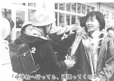
「中学校へ行っても、頑張ってください」