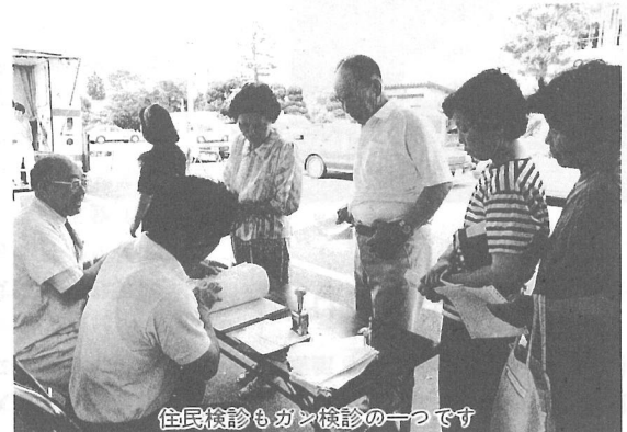
住民検診もガン検診の一つです

います。反対に「自分では何も悪いところはないんだから精密検査は受けない」という人もいます。精密検査というのは、「疑わしいところがあるので、もう少し精密検査は受けましょう。」