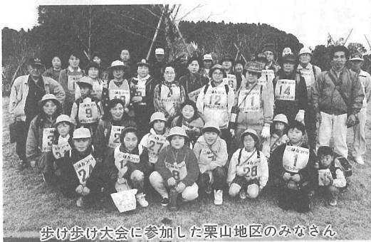
歩け歩け大会に参加した栗山地区のみなさん

当日は、途中から雨が降り出すというあいにくの天気でしたが、日頃歩くことの少ないお年寄りのみなさんには、いい運動だったようです。