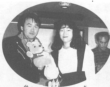
仲良く二人で記念撮影です。

この日参加した方々に話をうかがったところ「楽しかったです。来年もぜひ、企画してください」「次回も参加したいです」「たくさんの方々ができました。ありがとうございます」など、とても好評でした。みなさんも次回はぜひ、参加してみたいかががです。