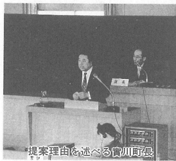
横芝町長が提案理由を述べる

過去3年間の実績と伸び率を基に推計し、前年対比16%増の6億7381万4千円となりました。