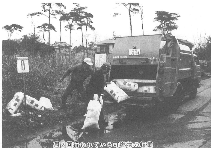
週2回行われている可燃物の収集