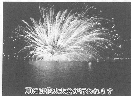
夏には花火大会が行われます

田池公園』に決定しました。これからはこのころのゆとりが求められる時代です。そこで、花や木に親しみ水辺を散策し、スポーツに汗を流す。そんな人と人とのふれあいの場としてふさわしい名称として選ばれました。