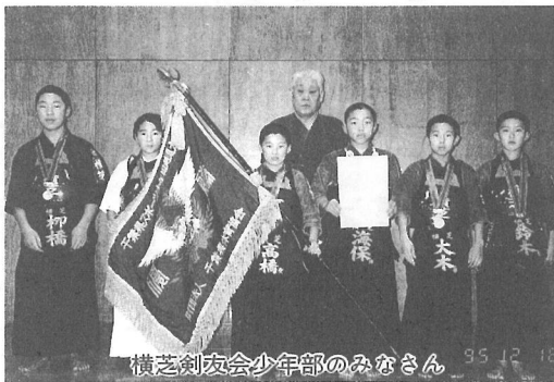
横芝剣友会少年部のみなさん 95.12.18