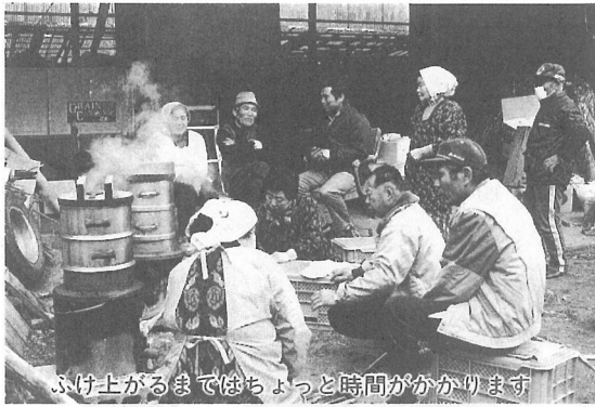
ふけ上がるまではちょっと時間がかかります